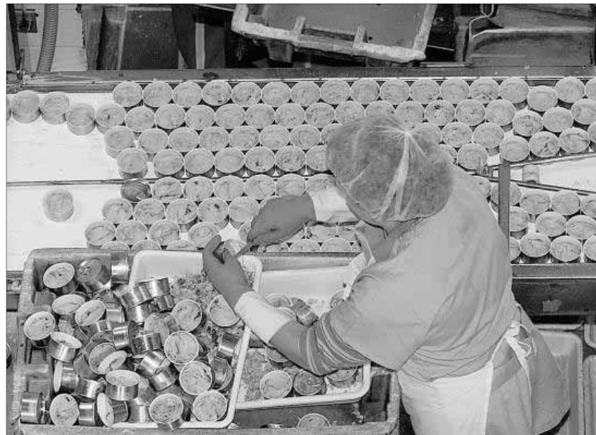
Una operaria trabajando en una conservera gallega.

La industria transformadora, además de dudar de la calidad de los productos procedentes de terceros países, denuncia que no pueden luchar contra unas empresas que cuentan con unos costes laborales mucho más bajos. "En Tailandia, por ejemplo, un trabajador de una conservera gana entre 120 y 180 dólares al mes y en Papúa Nueva Guinea entre 50 y 60 dólares y contra esos salarios no podemos competir. Estamos buscando permanentemente vías para salvar estos obstáculos, aunque lo tenemos muy difícil", indica Vieites.