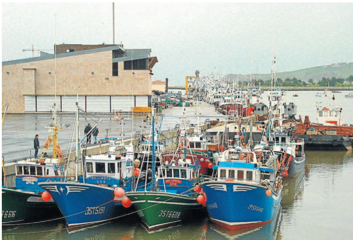
El puerto de San Vicente de la Barquera es el cuarto en la región en volumen de pesca desembarcada. :: v. c.