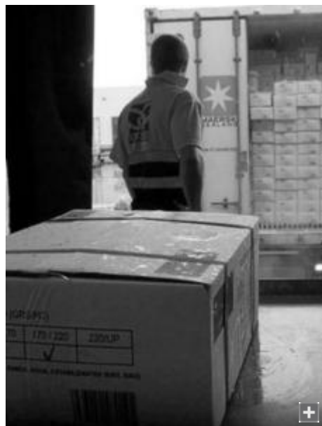
Un transportista entrega una muestra de pescado congelado en el PIF de Algeciras para su inspección.

Los empresarios del Campo de Gibraltar temen que la nueva Orden Ministerial por la que se han designado los puertos donde estará permitido el desembarco y transbordo de productos pesqueros termine con la