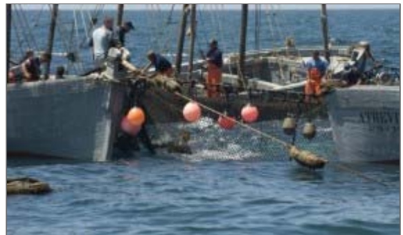
Los almadraberos siguen con su futuro en el aire

Los afectados siguen esperando a la convocatoria de reunión con el Ministerio, un encuentro en el que se darán cita todas las partes afectadas y de la que esperan conseguir una solución a esta reducción de las capturas.