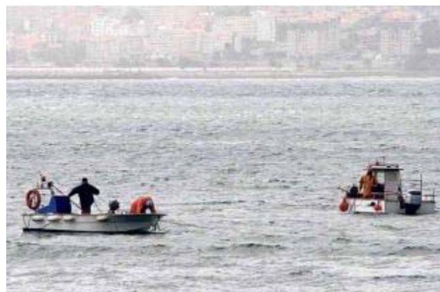
Una imagen del marisqueo a flote en la ría de Vigo, en la zona canguesa de Rodeira. Carmen Giménez

CRISTINA G. - MORRAZO Las cofradías de pescadores de la ría de Vigo siguen sin lograr el ansiado consenso del sector para sacar adelante un plan de explotación conjunto de los recursos marisqueros, centrados principalmente en la almeja y el berberecho. En el nuevo Plan de Explotación Marisquera para 2010, que acaba de aprobar la Consellería do Mar, la ría vuelve a figurar como zona de libre marisqueo sujeta a autorizaciones mensuales de la Xunta, tanto para el marisqueo a pie como a flote, salvo en ocho zonas de trabajo en donde sí figuran planes específicos, que los rigen las entidades o las cofradías solicitantes y en Baiona que tiene su propio plan para almeja rubia, japónica, babosa, reloj y caramujo.