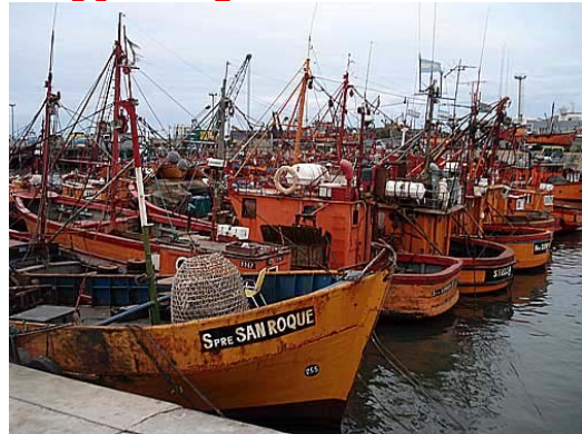
Mar del Plata sigue encabezando holgadamente la estadística.

Mar del Plata ya concentra más del 50% de las descargas, mientras en cuatro provincias de la Patagonia se desembarcó el resto. A pesar de la caída global en las capturas, los fresqueros y congeladores pescaron más que el año pasado.