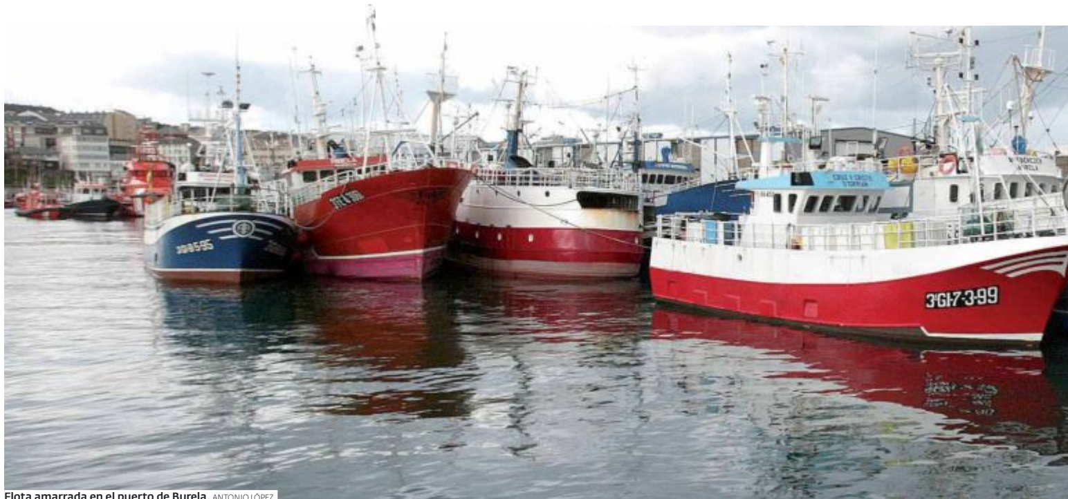
Flota amarrada en el puerto de Burela. ANTONIO LÓPEZ