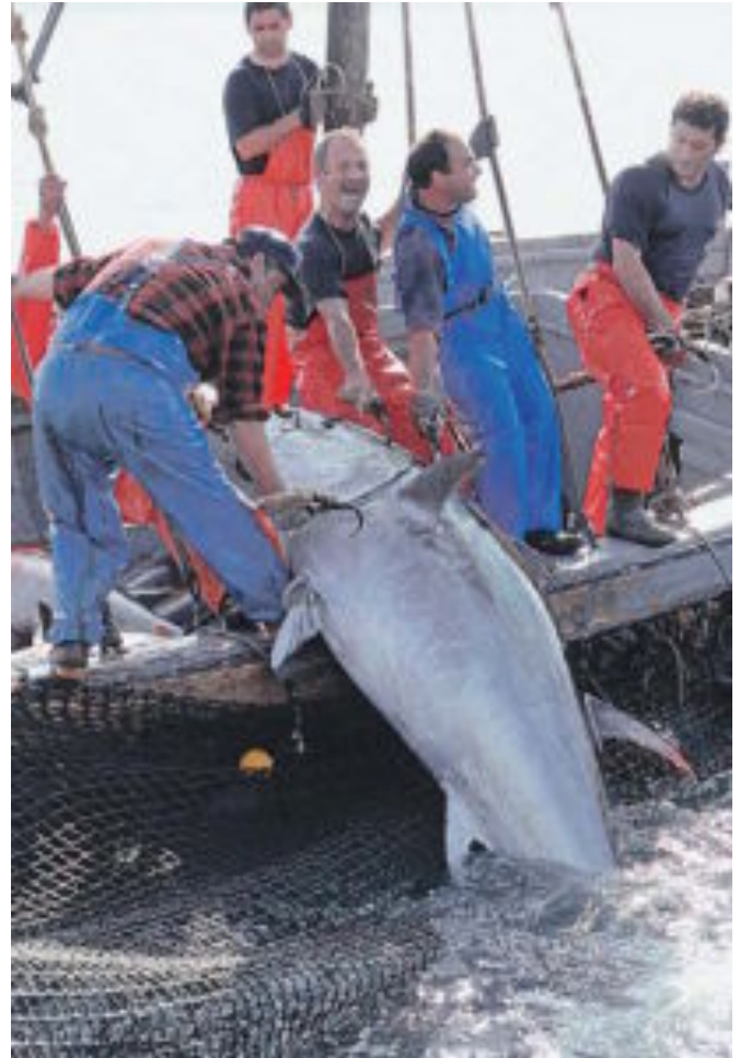
El 80% de las capturas en la costa gaditana va al mercado japonés.