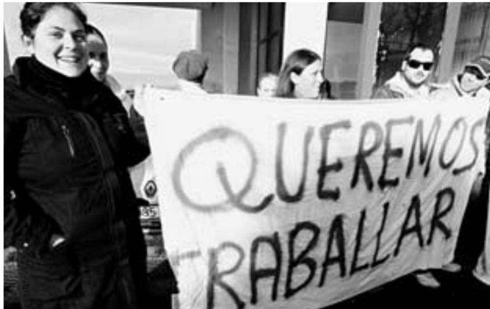
Las protestas de los mariscadores de Lazareto seguirán mañana mismo en Carril

En el seno de Lazareto se sigue mascullando la opción de que finalmente sean 15 plazas en total, a las que habría que restar las 6 del libre marisqueo, con lo que