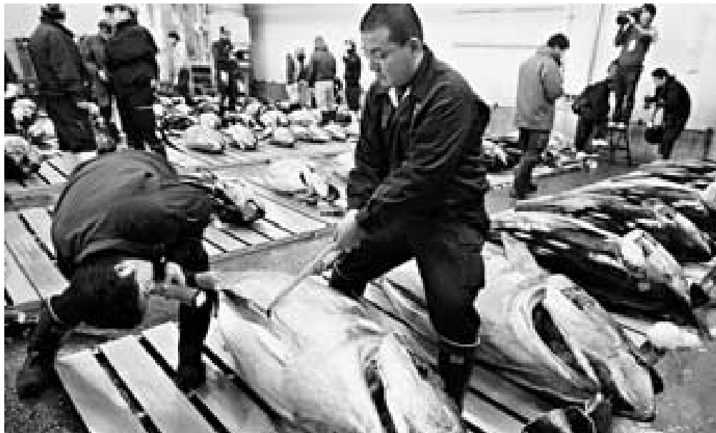
Pescadores japoneses inspeccionan un atún rojo en la lonja Tsukiji de Tokio, la mayor del mundo

En concreto, el Ejecutivo comunitario tiene que explicitar qué postura defenderá durante